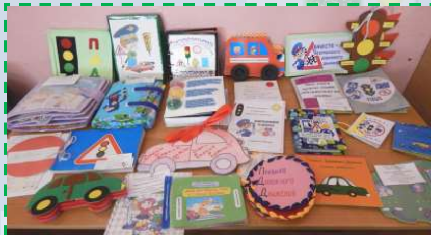
Книжки - малышки выполненные детьми и родителями