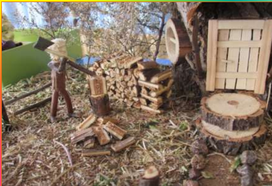
«Мастерим вместе с папой»