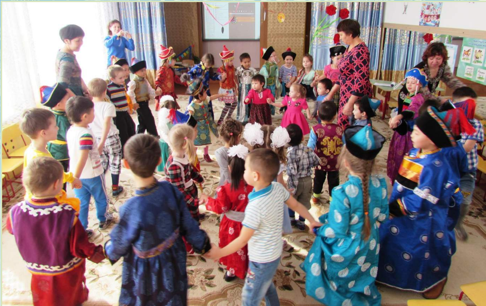
Ёхор Хоринский бурят