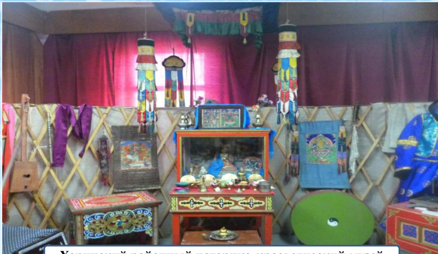
Хоринский районный историко-краеведческий музей

«...Нести в ладонях живую воду памяти, искать идеал и гармонию в прошлом, в традициях и обычаях мы стали ради будущего»